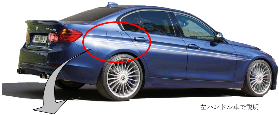
左ハンドル車で説明